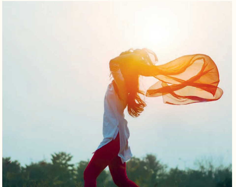
La médecine complémentaire est très appropriée pour activer les forces d'autoguérison.

En cas de coupure, par exemple, l'organisme réagit physiologiquement par la coagulation du sang. L'autoguérison est régie, orchestrée par un élément supérieur. Dans les disciplines de médecine complémentaire, on parle, en médecine anthroposophique, de l'organisation du moi, en médecine traditionnelle chinoise, de Qi et Tao et, en homéopathie classique, de force de vie.